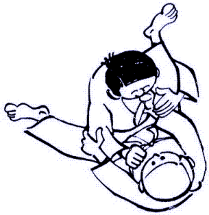
Tori entre les jambes d'Uke