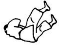
Chute avant (droite et gauche)