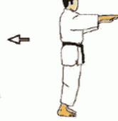
Chute arrière (assis et accroupi)