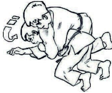
Tori a 4 pattes, Uke en position supérieure